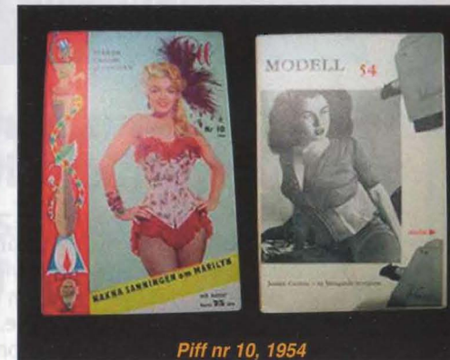
Piff nr 10, 1954

Slutsats: Det verkar nog, trots allt, som om Jeanne och Marilyn kände varandra ganska väl. Jag nämnde tidigare i artikeln att jag hade en tidning, Piff , som innehöll en artikel om Jeanne, passande nog så var det just Marilyn på omslaget. ■