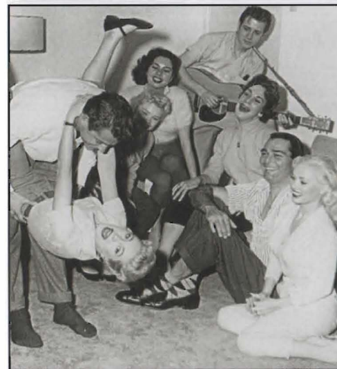
Ett party i samband med inspelningen av filmen Untamed Youth . Här ser vi Eddie Cochran (med gitarr) och Jeanne, med mörkt hår och klädd i vit angorajumper, hon sitter bredvid Eddie.

Jeanne: "Att jag började med film var nog det sämsta jag kunde ha gjort. Jag gillade det inte.